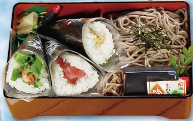
平日茶碗蒸し付 151 ほうずき 1,100円 (税込 1,188円)