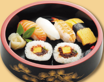
セット用にぎり 650円 (税込 702円)