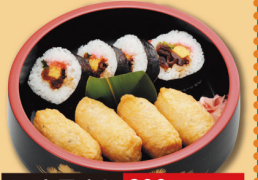
セット用助六 600円 (税込 648円)