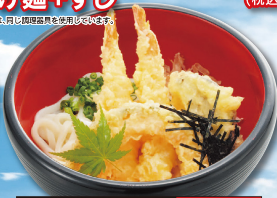
天ぷら ・うどん ・そば 単品 900円 (税込 972円)