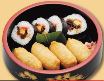
セット用助六 600円 (税込 648円)