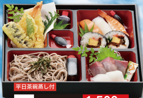
平日茶碗蒸し付 152 あじさい 1,500円 (税込 1,620円)