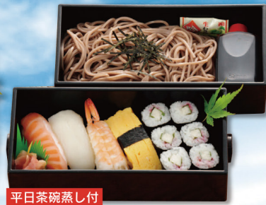
平日茶碗蒸し付 150 ききょう 1,100円 (税込 1,188円)